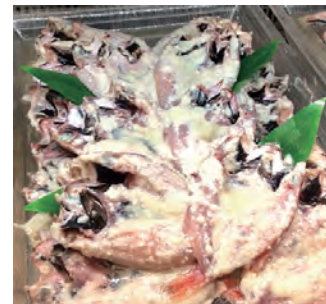
赤ムツの開きを塩麴漬けに

そそのるので、塩焼きとはまた違った旨味を感じられます。西浅各店ではその日仕入れたとっておきのお魚を使ったいろいろな塩麴漬けを販売しております。焼き方は味噌漬けと同じく余分な塩麴を軽くキッチンペーパーなどでぬぐって焦げ目がつかないようじっくり焼いて下さい。簡単で美味しいメイン料理ができますよ!