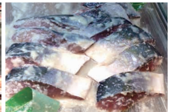
ブリの塩麴漬け 脂のある魚が比較的相性が良いです